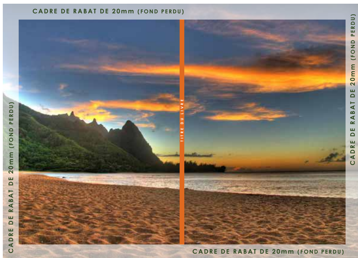
MAQUETTE DU FICHIER DE LA COUVERTURE